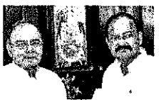
जीएसटी को संभव बनाने में अहम जेटली (बाएं) और वेंकेया नायडू की अहम भूमिका