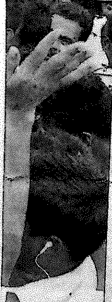
गत करते विधानमंडल के भी और 20 लोग घायल

घटनाक्रम के तहत वहां नेतृत्व परिवर्तन किया। केंद्रीय गृह राज्यमंत्री रिजीजू ने यहां संवाददाताओं से कहा कि हमारा कांग्रेस के अंदरूनी मामलों से कुछ लेना-देना नहीं है। अरुणाचल प्रदेश में कांग्रेस ने नाटकीय घटनाक्रम में पेमा खांडू को नया नेता चुन कर मुख्यमंत्री नवाम तुकी को बदल दिया। खांडू ने वो निर्दलियों सहित पार्टी के 45 विधायकों के समर्थन से सरकार बनाने का दावा किया। बग़ावत कर मुख्यमंत्री बने और फिर सुप्रीम कोर्ट की ओर से अपकस्थ किए गए खालिको-पुल तेजी से बदलते घटनाक्रम में 30 असंतुष्ट विधायकों के साथ पार्टी खेमे में लौट आए। अरुणाचल प्रदेश से सांसद रिजीजू ने कहा कि अरुणाचल प्रदेश में मुख्यमंत्री बदलना कांग्रेस का अंदरूनी मामला है। भाजपा का इससे कोई लेना-देना नहीं है। यह भाजपा की सरकार नहीं थी। भाजपा ने केवल सरकार का समर्थन किया। जो कुछ भी हुआ था, वह कांग्रेस नेताओं के बीच टकराव के चलते हुआ।