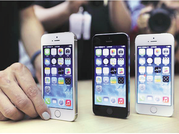
Apple's old smartphones iPhone 5 or 5S cost around ₹16,000 in India, much higher than the majority of smartphones that use Google's Android software

India might allow Apple, the world's largest smartphone maker, to set up units to refurbish its iPhones in this country, with a caveat that it exports these, not sell in the local market. This is in the wake of overtures by Apple to sell used iPhones in India. It has sought a list of exemptions to the normal rule, including a 15-year tax holiday. "As long as they (Apple) are exporting, we don't have a problem. They have asked for exports. Demands around packaging are very minor," said information technology secretary Aruna Sundararajan here on Friday. The government's preventing Apple from selling its refurbished phones here could be a dampener for the company, looking at India as the next China. Apple saw its best sales in the quarter to December in India but has less than three per cent of the largely price-sensitive market, dominated by global rival Google. Apple's old smartphones iPhone 5 or 5S cost around ₹16,000 in India, much higher