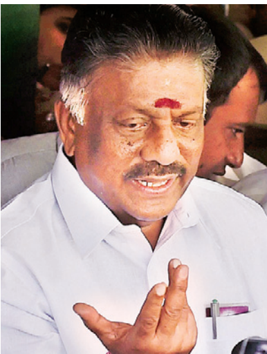
ओ पनीरसेल्वम, तमिलनाडु मुख्यमंत्री

वह वर्ष 2006 में एक बार फिर विधानसभा के लिए चुने गए थे। जब उन्होंने पेरियाकुलम विधानसभा क्षेत्र से अपना नामांकन दाखिल किया था तो उन्होंने अपने हलफनामे में 20.81 लाख रुपये की कुल संपत्ति होने की बात कही थी। उसमें से करीब 15.5 लाख रुपये चल संपत्ति के रूप में थी। पनीरसेल्वम के पास 1.44 लाख रुपये की नकदी होने के अलावा चेनई के एक बैंक खाते में 1.56 लाख रुपये जमा बताए गए थे। वहीं उनकी पत्नी पी विजयालक्ष्मी के पास 3.74 लाख रुपये नकद और पेरियाकुलम के बैंक खाते में 8.76 लाख रुपये जमा होने की जानकारी दी गई थी। इसके अलावा उनकी पत्नी के पास करीब 1.5 लाख रुपये मूल्य के गहने भी थे। पनीरसेल्वम के पास शेंकराई गांव में एक